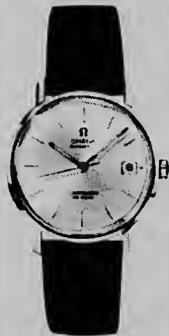
SEAMASTER DE VILLE, e oloshi plat pa caballero, cu ta impermeable den su kashi, locual ta pone su mecanismo, ser doble protehá. E ta automático, eventual cu calendario, antimagnético, shockproof. PREJS for di F. 98.--